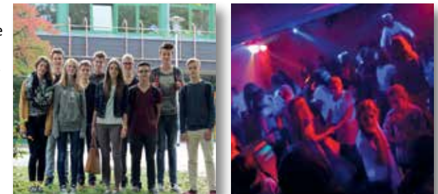
Patenschaften und PansDäns

Die erste Fremdsprache ist Englisch. In der Jahrgangsstufe 6 (Wahlpflichtbereich I- WPI) werden als zweite Fremdsprache Französisch und Latein zur Wahl gestellt. Während der Erprobungsstufe wird regelmäßig über die Entwicklung der Schülerinnen und Schüler beraten. Am Ende der Erprobungsstufe entscheidet die Klassenkonferenz über ihre gymnasiale Eignung.