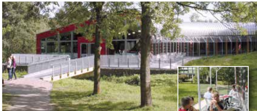
Mensabereich der Schule

Das Schulgelände wird von den meisten Schülerinnen und Schülern über gute Schulbusverbindungen erreicht, viele kommen auch mit dem Fahrrad.